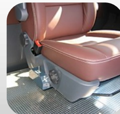
Embase 6 positions