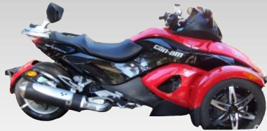
Freinage adapté et Cales pied spéciaux