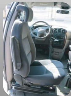
Embase pivotante intérieure