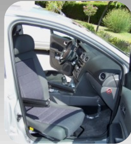
Siège pivotant passager