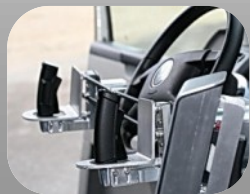
Conduite joystick « Joysteer »