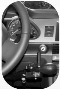
Accélérateur à gâchette