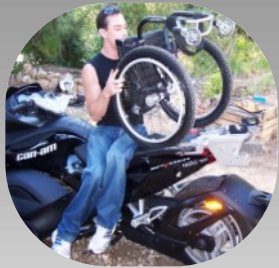
Can-Am Spyder Support fauteuil conçu sur mesure