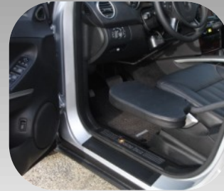
Releveur finition cuir