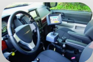
Conduite Joystick EMC