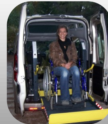
Hayon repliable sur Doblo rehaussé