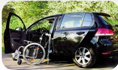
Porte coulissante et robot chargeur