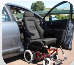
Système « Carony »