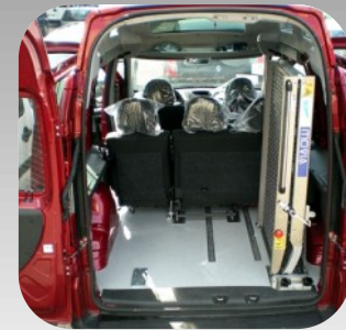
Rampe pivot à droite